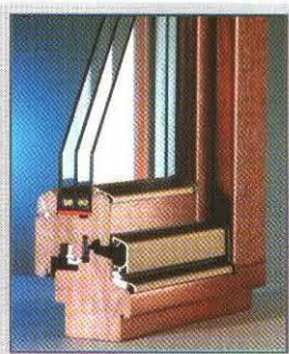
ÚSPORA ENERGIE IZOLAČNÉ TROJSKLO