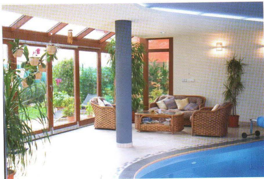
Jedna z realizácií firmy MIRADOR, rodinný dom pri Senci