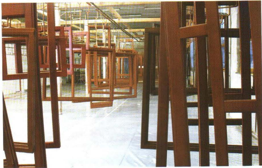
Priestranná impregnačná a lakovacia linka

len eurohranoly zaradené do najvyšších kvalitatívnych tried, spĺňajúcich kritériá noriem DIN 68360, ÖNORM B-3031 a STN 490251. Ide o komponenty, ktoré sú zlepené z troch, resp. štyroch lamiel, s radiálnym a poloradiálnym sklonom, čo zaručuje ich tvarovú stabilitu. Vďaka spomínaným technológiám možno našu výrobu okien považovať za mimoriadne flexibilnú, pričom kvalita výrobku ostáva zachovaná za každých okolností – či si zákazník objedná jeden kus, alebo množstvo potrebné na celkové vybavenie domu, či príde dnes, alebo o tri roky. Dokážeme mu ponúknuť rôzne atypické riešenia, napríklad oblúkové alebo trojuholníkové modely. Veľký potenciál v sebe skrývajú napríklad drevo-hlinikové okná, originálnym systémom výroby ktorých disponujú na Slovensku možno dve firmy, ale aj zatiaľ nedocenené, no architektonicky efektívne drevo-hlinikové fasádne systémy.